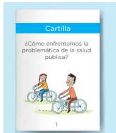
Puedes diseñarla en la forma de una revista.